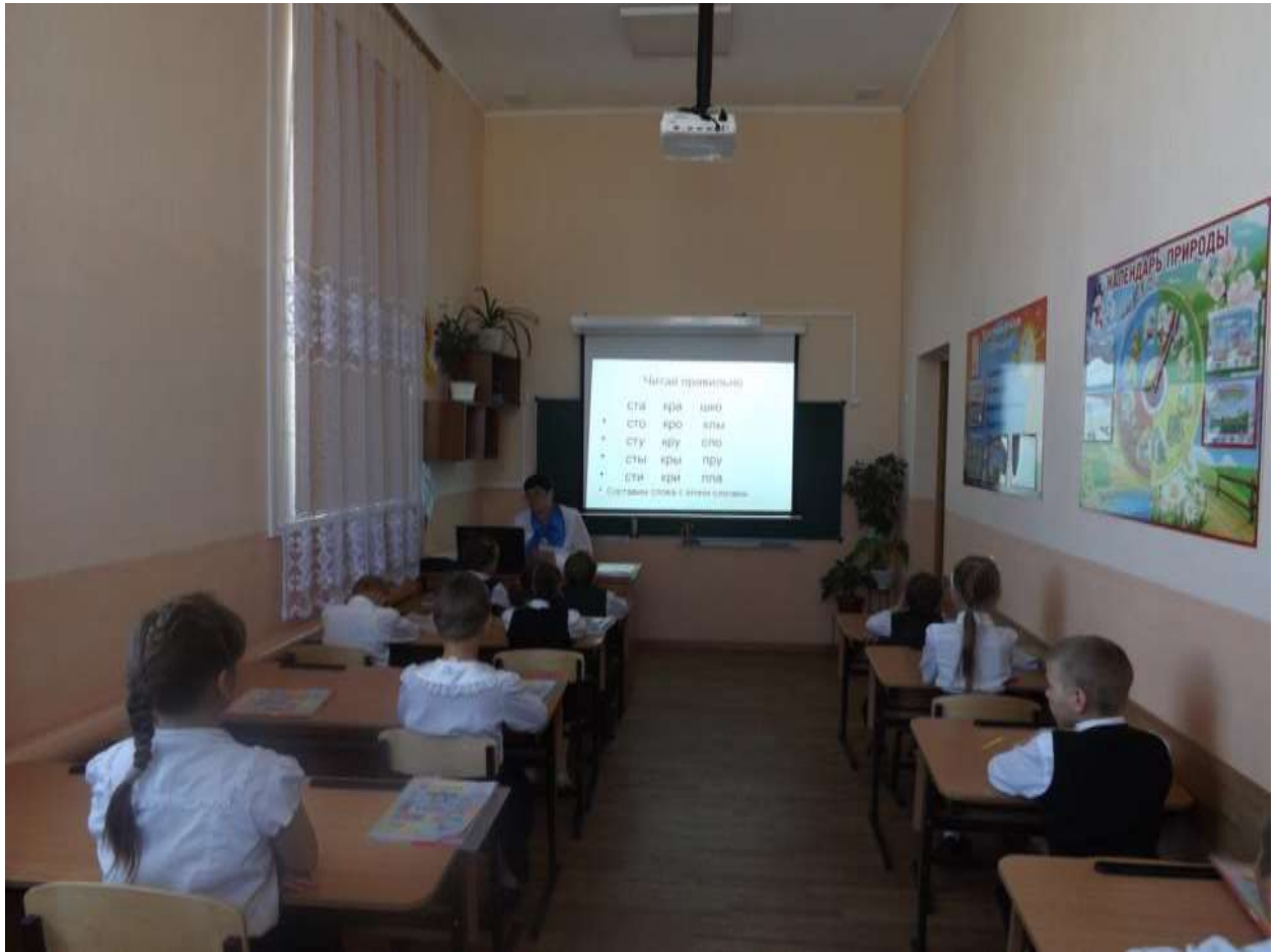
Урок чтения 1 класс