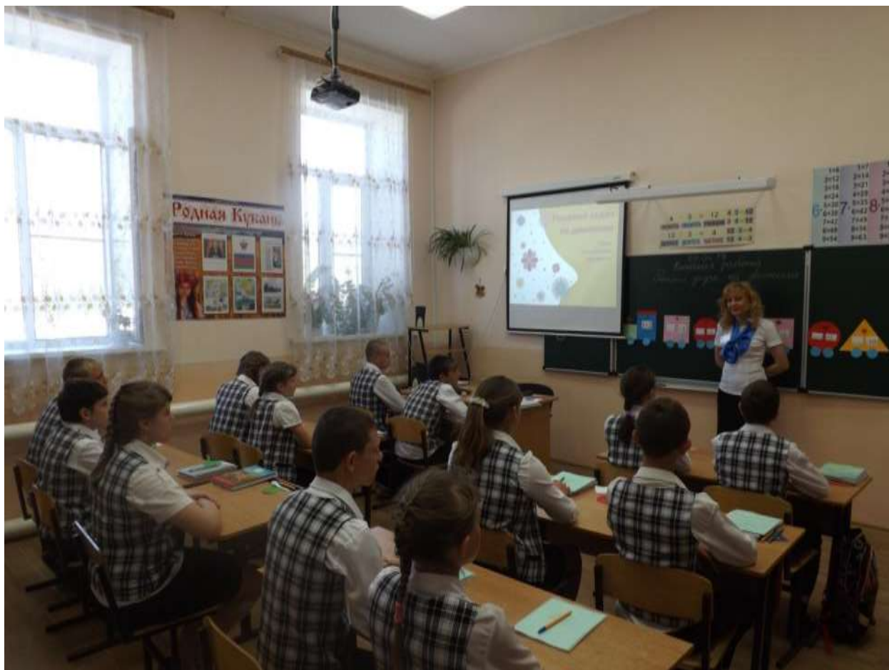
Урок математики 6 класс

Были показаны открытые уроки по общеобразовательным предметам (чтение, письмо и развитие речи, математика, природоведение) и профессионально-трудовому обучению (сельскохозяйственный труд, столярное дело, швейное дело).