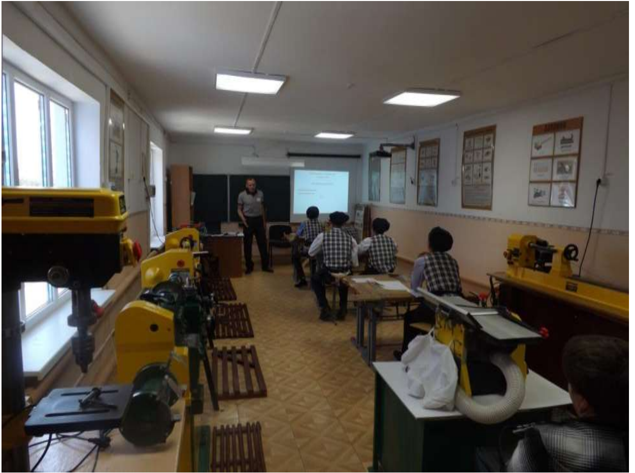
Урок столярного дела 8 класс