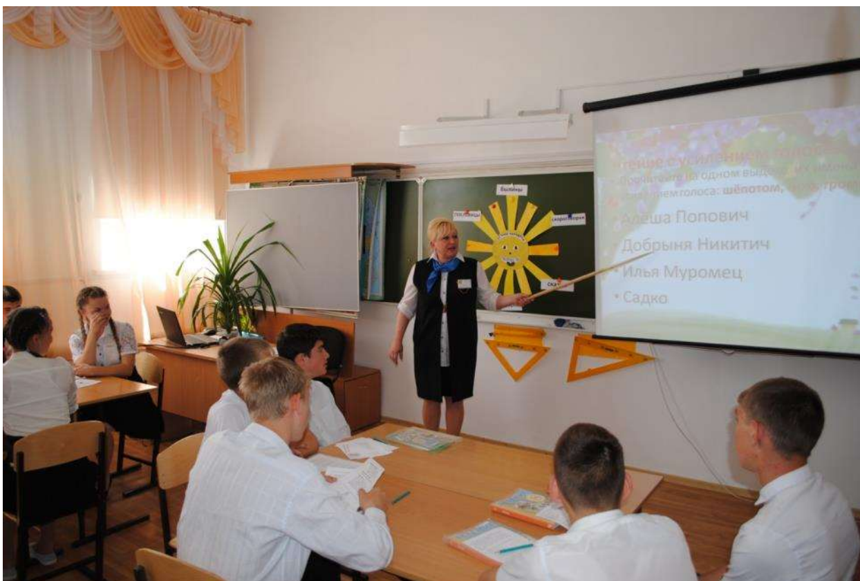
Урок чтения и развития речи 8 класс