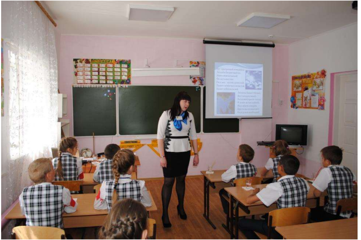
Урок природоведения 5 класс